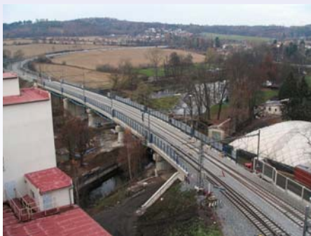
Pohled na měřenou oblast

Výsledky z měření zatím nejsou dostupné.