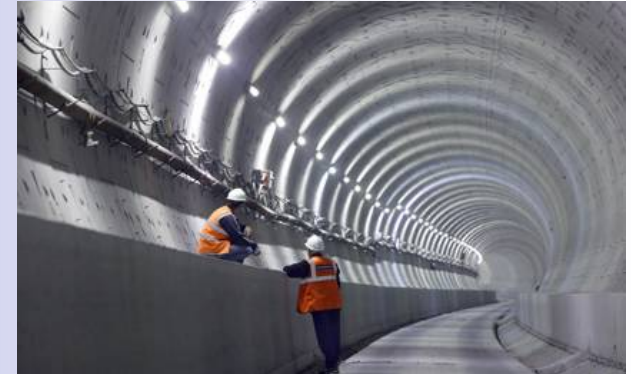
Projekt CTRL v Anglii (využití vláknobetonových segmentů)

Možná spolupráce s ŽPSV Uherský Ostroh již v tomto projektu (výroba zkušebních vzorků) případně i v pokračování projektu.